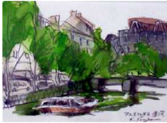
収蔵作品 水彩画『アムステルダム運河』千住喜八郎作

10:00～17:00 展示室 入場無料 (6日は13:30～・11日・18日は16:00まで)