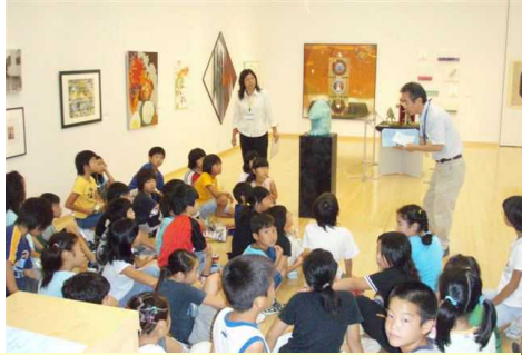
作家から直接説明を受ける子どもたち