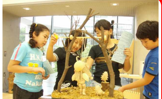
触れる美術品に思わず歓声が沸く

全館いっせいに子どもたちの歓声が沸きました! 8/28(火)～9/16(日)まで開催された「アートinはむら展 - アートフェスティバル -」。絵画、彫刻、など西多摩全域で活躍中の芸術家53人の作品約60点が展示され、ゆとりぎはさながら「美術館」に変身。期間中多くのお客様で賑わいました。中でも富士見小の4年生3クラスが図工の課外授業の一環として来館し、作家の解説を直接聞きながらの美術鑑賞を体験しました。このような「学校とゆとりぎの本格的な連携」は、今後生涯学習におけるゆとりぎの役割を広げる新たな試みとして大変注目されています。