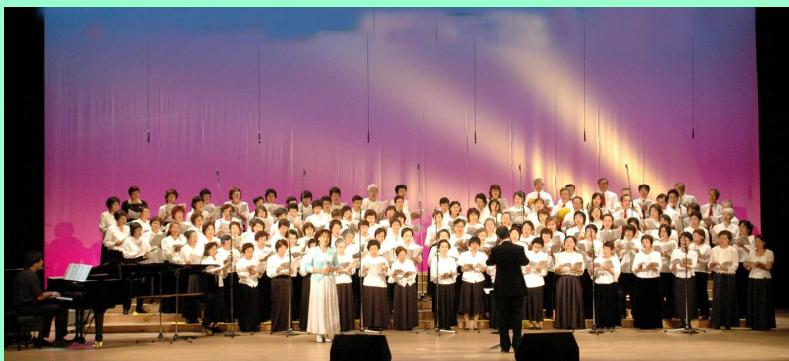
写真：ゆとろぎオープニングイベントより