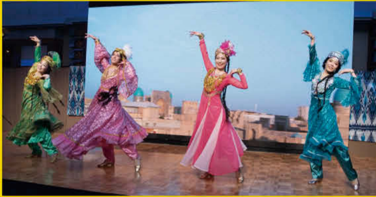
出演：ウズベキスタン ダンス アンサンブル ウズベギム

大人 (前売) 1,000円 (当日) 1,500円 高校生以下 500円 ※未就学児は入場できません。 【全席指定】 定員 326名