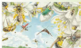
「つちはんみょう」(縦2m×横6m)