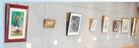
ゆとろぎ所蔵作品