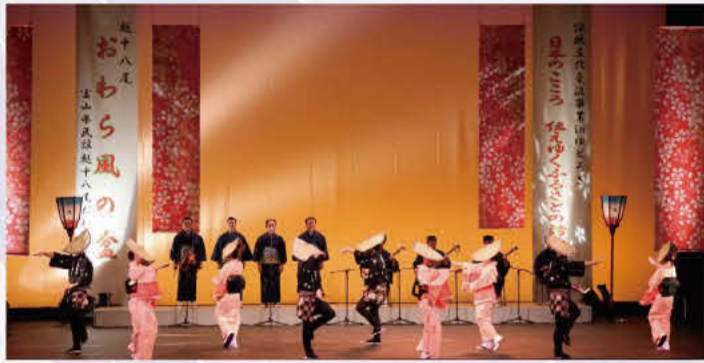
越中八尾おわら風の盆