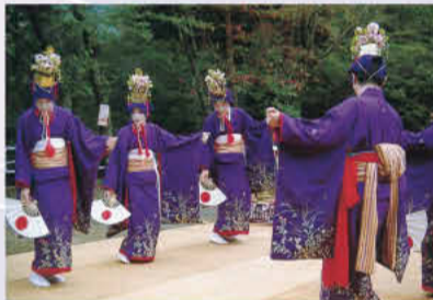
小河内の鹿島踊(国指定重要無形民俗文化財)