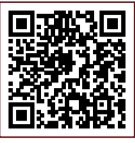
羽村市公式サイト (ゆとろぎ)

2024年6月15日(隔月15日発行) 6/15 ~ Vol.135 Copyright © 2008~2024 by YUTOROGI All rights reserved