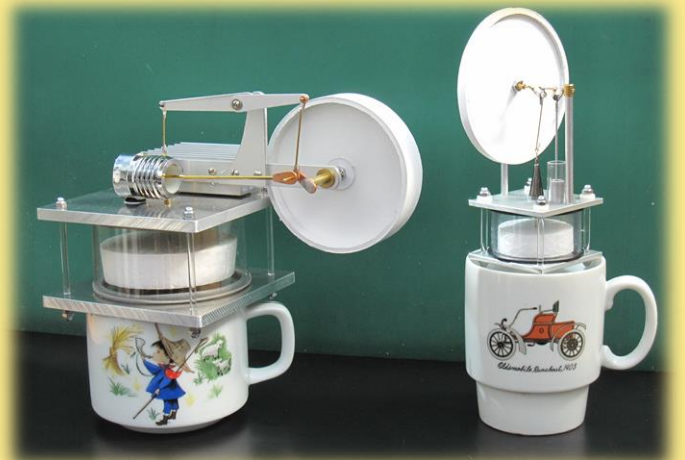
B 一杯のお茶で動く 空気エンジン