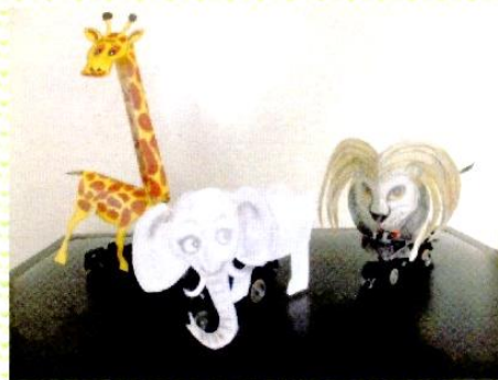
アニマルトレイン