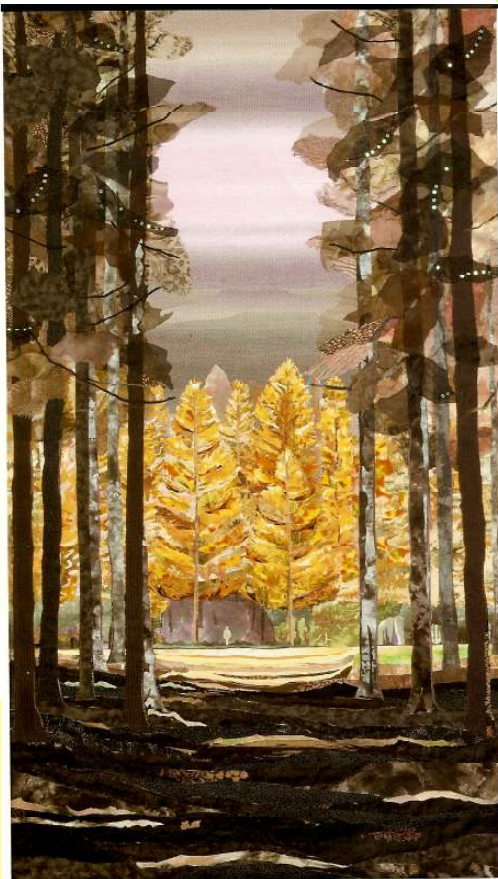
メタセコイヤの森へ 入山喜代美作