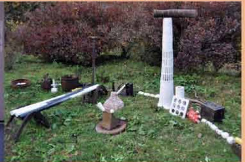
2017 出会い 青梅市長淵並木邸

現代人の忘れかけている土を使って、オブジェや集合体やインスタレーションで、人間の内宇宙、視覚では見えない霊・魂・オーラ・生命エネルギーをまるいものと解釈して、球体を制作し発表してきました。そして 旅で訪れたインドやイタリア・フランス・スペイン・ギリシャ・イギリスやエジプトなどの国々で、石の文化に触れ、たくさんの刺激を受け、遺跡からのイメージや人々の暮らす国々のイメージなどをテーマにして作品を制作するようになり、最近では、現代社会の中から都市や自然の記憶をオブジェとして制作しています。