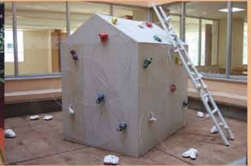
2006 ハウス 昭島病院光庭