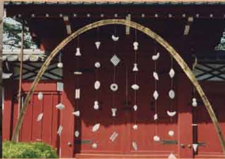
2001 コラボレーション 羽村市郷土博物館