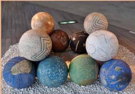
2011 立体曼荼羅 国営昭和記念公園花みどり文化センター