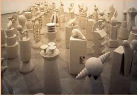
1996 50の物語 ギャラリー山口