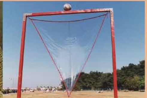
1989 風の色を見たかい 福生南公園