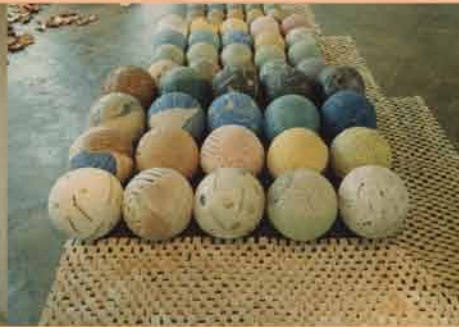
1988 壺のインフォメーション 佐賀町エキジビットスペース