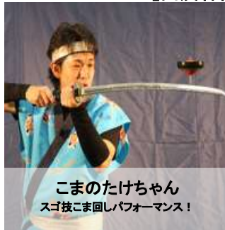
こまのたけちゃん スゴ技こま回しパフォーマンス!