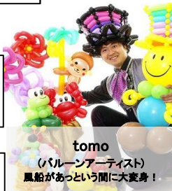
tomo (パルーンアーティスト) 風船があっという間に大変身!

12:30～香山ひまわりのクラウンショー 12:55～ちょこっとクラシック 13:20～tomoさんのパルーンショー