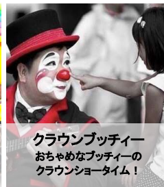
クラウンプッチー おちゃめなプッチーの クラウンショータイム!