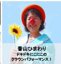
香山ひまわり ドキドキにここの クラウンパフォーマンス!

★大ホールのステージ鑑賞は入場券が必要です。(公演200枚配布) 事前にゆとろぎ窓口で希望の時間帯の入場券をお申込み下さい。